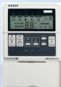
Žičani zidni digitalni kontroler