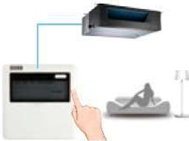
Žičani zidni digitalni kontroler KJR 12B